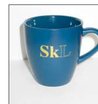
Krus kr 20,-

Alle profileringsartiklene er subsidierte, og de sendes fraktfritt ut. Bestilling kan sendes til: post@skl.no