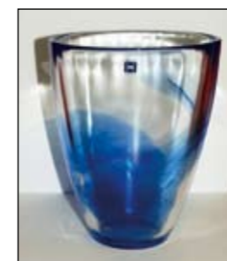
SkLs vase kr.250,-