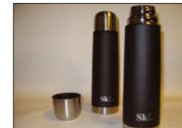
SkLs termos kr.75,-