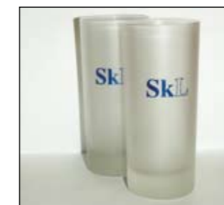
Glass kr 20,-