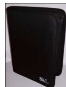
SkLs dokumentmappe kr 150,-