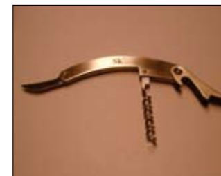
SkLs vinopptrekker kr 25,-